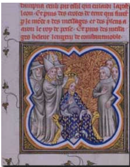
3. Vita Caroli miniatűr, Nagy Károly koronázása,