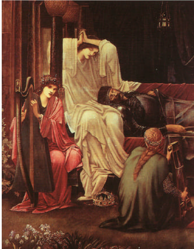
4. Edward Burne-Jones, Artúr Király utolsó éjszakája (nagyitva lásd a végén)

majdani uralmára lehet vonatkoztatni! Az Artúr legenda annyira ideális, hogy a fiatal Kennedy elnök alatt az idealista, fiatal politikusokból mint fénylő lovagokból összetett Fehér Házat is szinte félhivatalosan King Artúr Kamelotjáról nevezték el,